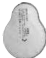
UNIX 213 P3 R D* противоаэрозольные с дополнительной защитой от органических газов и паров до 1 ПДК