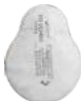
ДОТэко P3 D противоаэрозольные