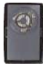
UNIX 303 P3 R D противоаэрозольные закрытого типа