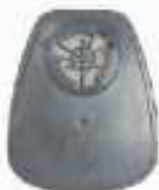
серии UNIX 500 противогазовые