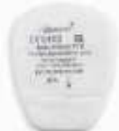
UNIX P1, UNIX P2, UNIX P3 противоаэрозольные (предфильтр)