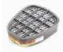
Фильтр UNIX 521 A1B1E1