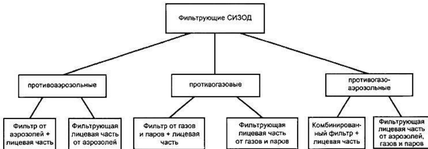
Рисунок 3 - Классификация фильтрующих средств индивидуальной защиты органов дыхания

Противоаэрозольные фильтрующие лицевые части и фильтры по эффективности защиты подразделяют на следующие классы: