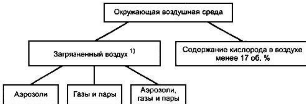
Рисунок 1 - Классификация окружающей воздушной среды

1) Загрязнение воздуха измеряется и оценивается на основе токсических свойств загрязняющих (его) веществ (а).