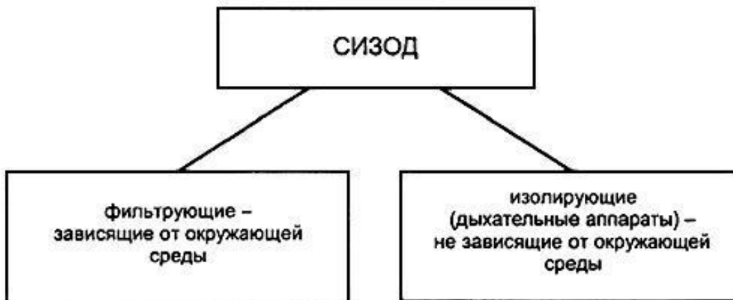
Рисунок 2 - Классификация средств индивидуальной защиты органов дыхания

Фильтрующие средства индивидуальной защиты органов дыхания Фильтрующие СИЗОД без принудительной подачи воздуха по конструкции